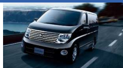
日産 G30 (3コートパール)