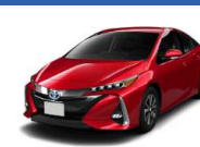
トヨタ 3T7 (カラークリヤーメタリック)