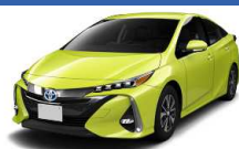
トヨタ 6W7 (3コートパール)

特に難しいカラーの一例です。通常よりもお時間がかかったり、別途費用が発生する場合があります。