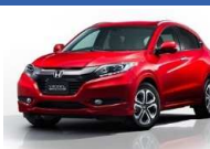
ホンダ R565M (カラークリヤーメタリック)